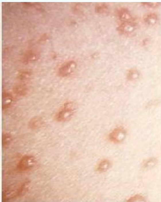
Сыпь при ветрянке