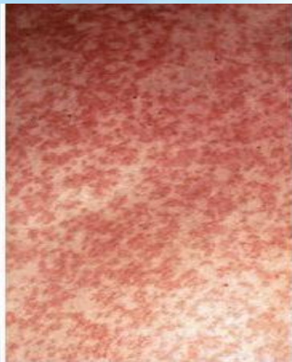
Сыпь при краснухе